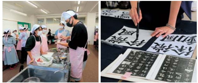
※写真はイメージとなります。